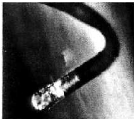
Obr. 13: Hlavička vlákna Morgellona.