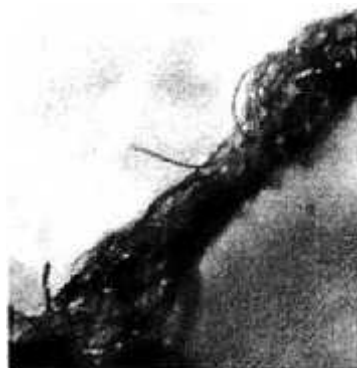
Obr. 14: Síť nanovláken.

„Vlákna, jež prší z nebe, vypadají jako nejjemnější cukrová vata“, vysvětluje Dr. Staninger. Jedná se o spojení nanočástic. Jednotlivé součásti jsou pouhým okem neviditelné.